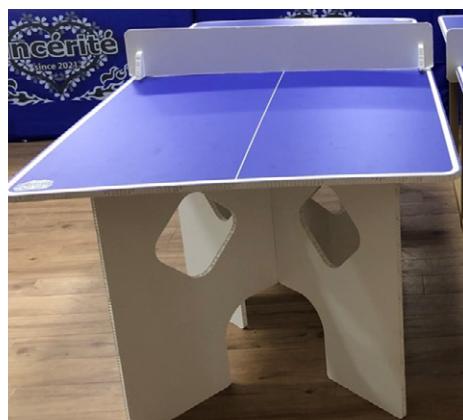
段ボール卓球台・ラケット